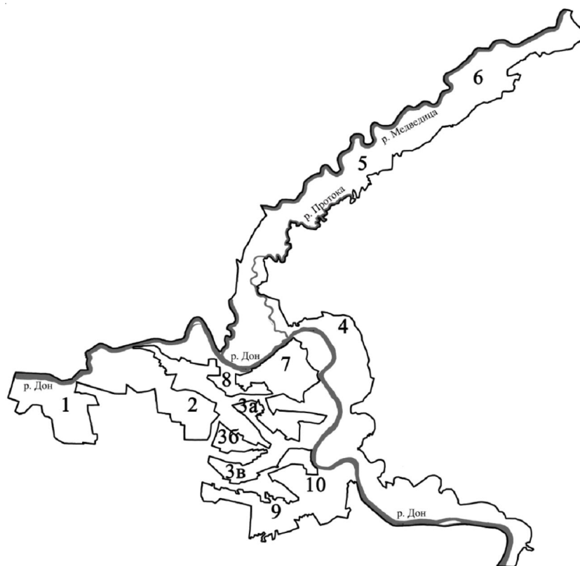
Рис. 2. Картограмма Усть-Медведицкого природного парка и наиболее важных природоохранных объектов:

Существенная доля территории парка приходится на широкие долины рек Дона и Медведицы. Для них характерны пойменные дубравы, черноольшаники, ветляники, сообщества тополя белого и черного, а также луговые, водные и околотоводные биотопы. Сочетание зональных, экстразональных и азональных растительных сообществ является отличительной чертой ландшафтов УМПП и пре-