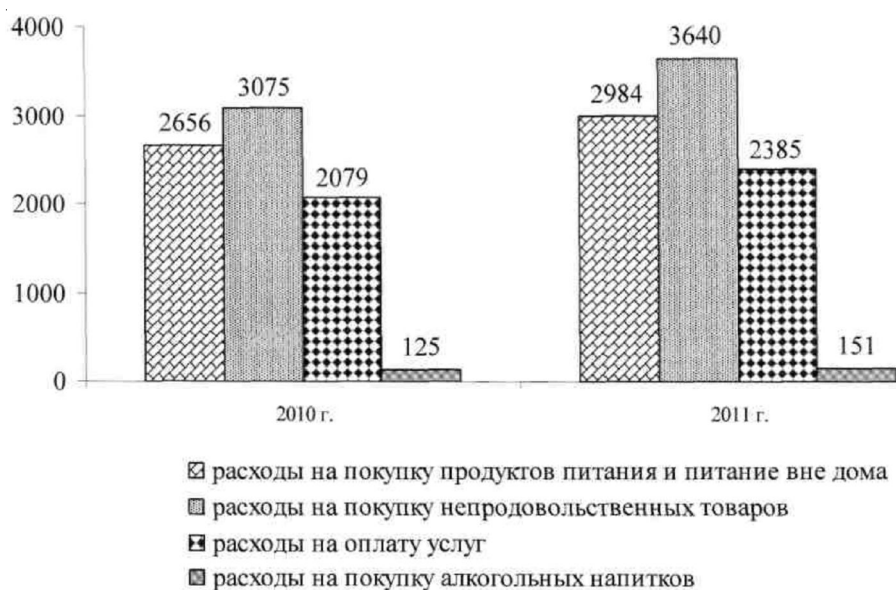
Рис. 1. Потребительские расходы домашних хозяйств Волгоградской области в 2010–2011 гг. (в среднем на члена домашнего хозяйства в месяц, руб.)

Доля средств семейного бюджета, затрачиваемых на покупку продовольственных