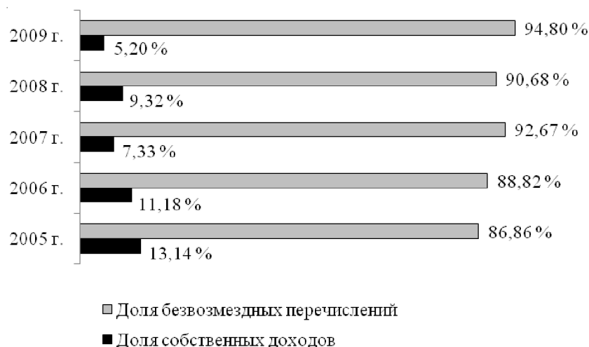
Рис. 1. Доля собственных доходов и безвозмездных перечислений в консолидированном бюджете Чеченской Республики *

Следующая проблема финансово-бюджетной политики местных властей – это обеспечение самодостаточности местных бюджетов. Данные таблицы 1 демонстрируют стабильный рост поступлений в бюджеты муниципальных образований по годам. В сравнении с 2005 г. доходы местных бюджетов в 2009 г. выросли в 6 раз. Это связано с активными восстановлениями социально-культурных объектов, увеличением занятости населения и соответственно ростом налога на доходы физических лиц (см. табл. 1).