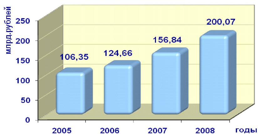
Рис. 4. Оборот малых предприятий в Волгоградской области *

В 2008 г. инвестиции в основной капитал составили 7404,4 млн руб. (см. рис. 5), что в 2 с лишним раза больше, чем в 2007 году.