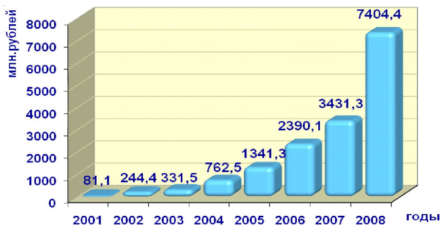
Рис. 5. Инвестиции в основной капитал малых предприятий *