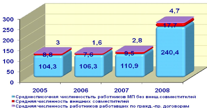
Рис. 3. Средняя численность работников малых предприятий в Волгоградской области *