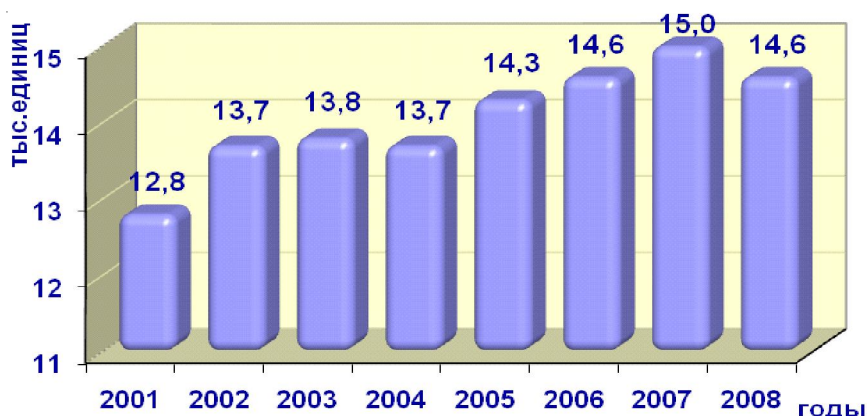
Рис. 2. Динамика развития малых предприятий **

В 2008 г. среднемесячная заработная плата работников малых предприятий выросла до 8,7 тыс. руб. Оборот малых предприятий к концу 2008 г. превысил 200 млрд руб. (см. рис. 4), или 127,6 % роста относительно 2007 г., что составило 22 % общего оборота организаций Волгоградской области. В среднем, в расчете на 1 малое предприятие, оборот составил 13,7 млн руб.