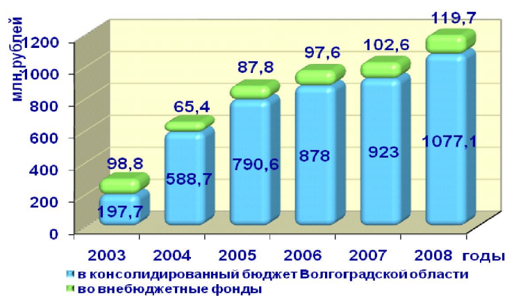
Рис. 7. Единый налог на вмененный доход для отдельных видов деятельности *