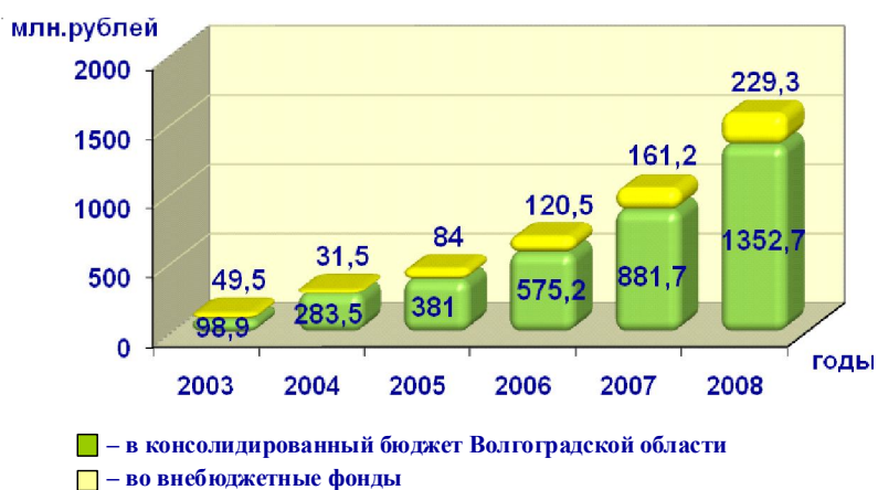
Рис. 6. Единый налог, взимаемый по упрощенной системе налогообложения *