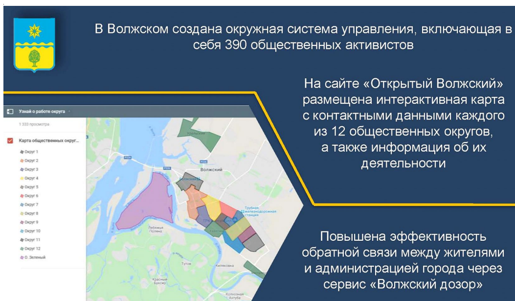
Рис. 2. Повышение эффективности взаимодействия администрации г. Волжского с жителями

Примечание. Составлено по: [Доклад ...].