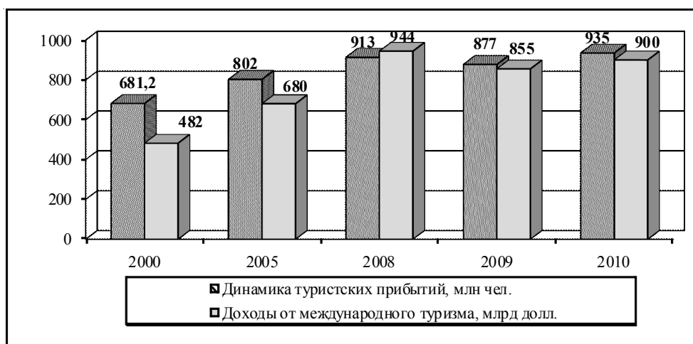
Рис. 1. Динамика туристских прибытий и поступлений от международного туризма в мировой экономике в 2000–2010 гг.*

Такая устойчивость туризма в значительной степени обусловлена эластичностью спроса на туристские услуги. Спад в туризме имеет ограниченный характер, что служит подтверждением устойчивости туризма в неблагоприятных ситуациях, опирающейся на постоянную потребность в путешествиях и досуге