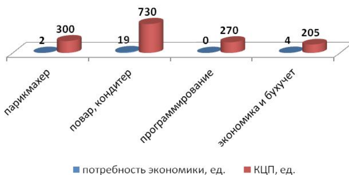
Рис. 2. Сравнительный анализ структуры контрольных цифр приема и заявленной потребности в разрезе специальностей подготовки (выборочно)