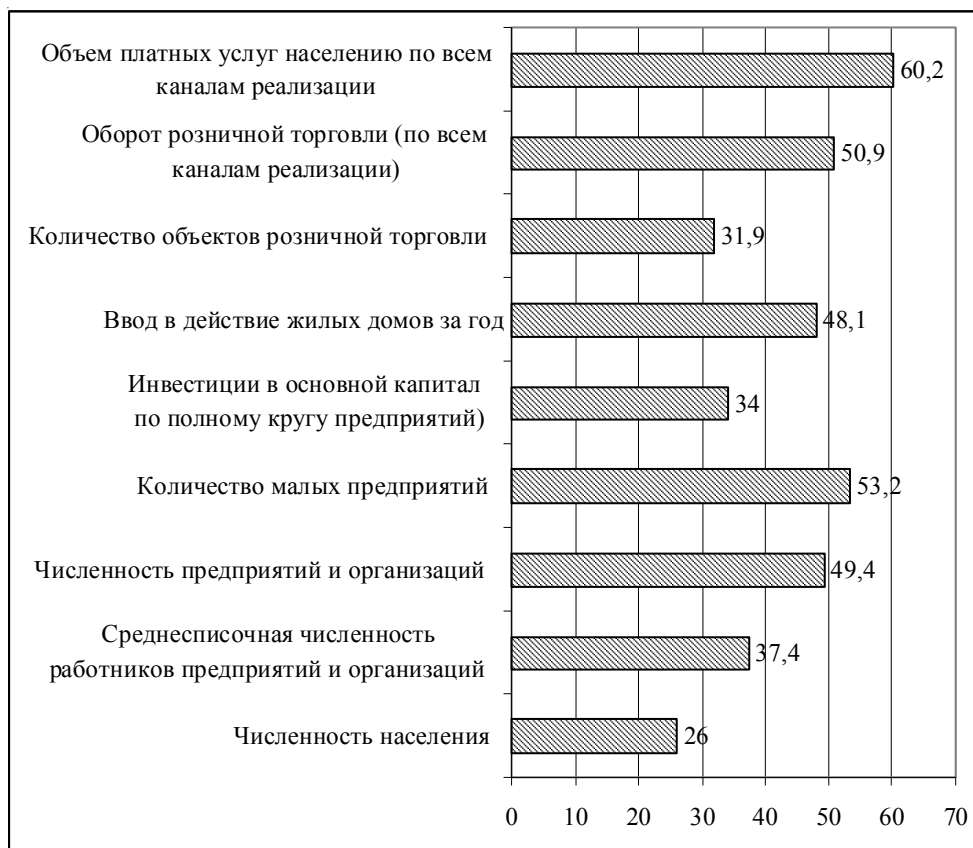
Рис. 2. Доля Ростова-на-Дону в основных социально-экономических параметрах Ростовской области Примечание. Составлено по: [11; 15].

Ростов вместе с прилежащими к нему населенными пунктами образует Ростовскую агломерацию. При этом ряд муниципалитетов (прежде всего города Аксай и Батайск) в силу процессов субурбанизации практически срослись с Ростовом-на-Дону в единое городское пространство, образуя ядро центрo-периферий-