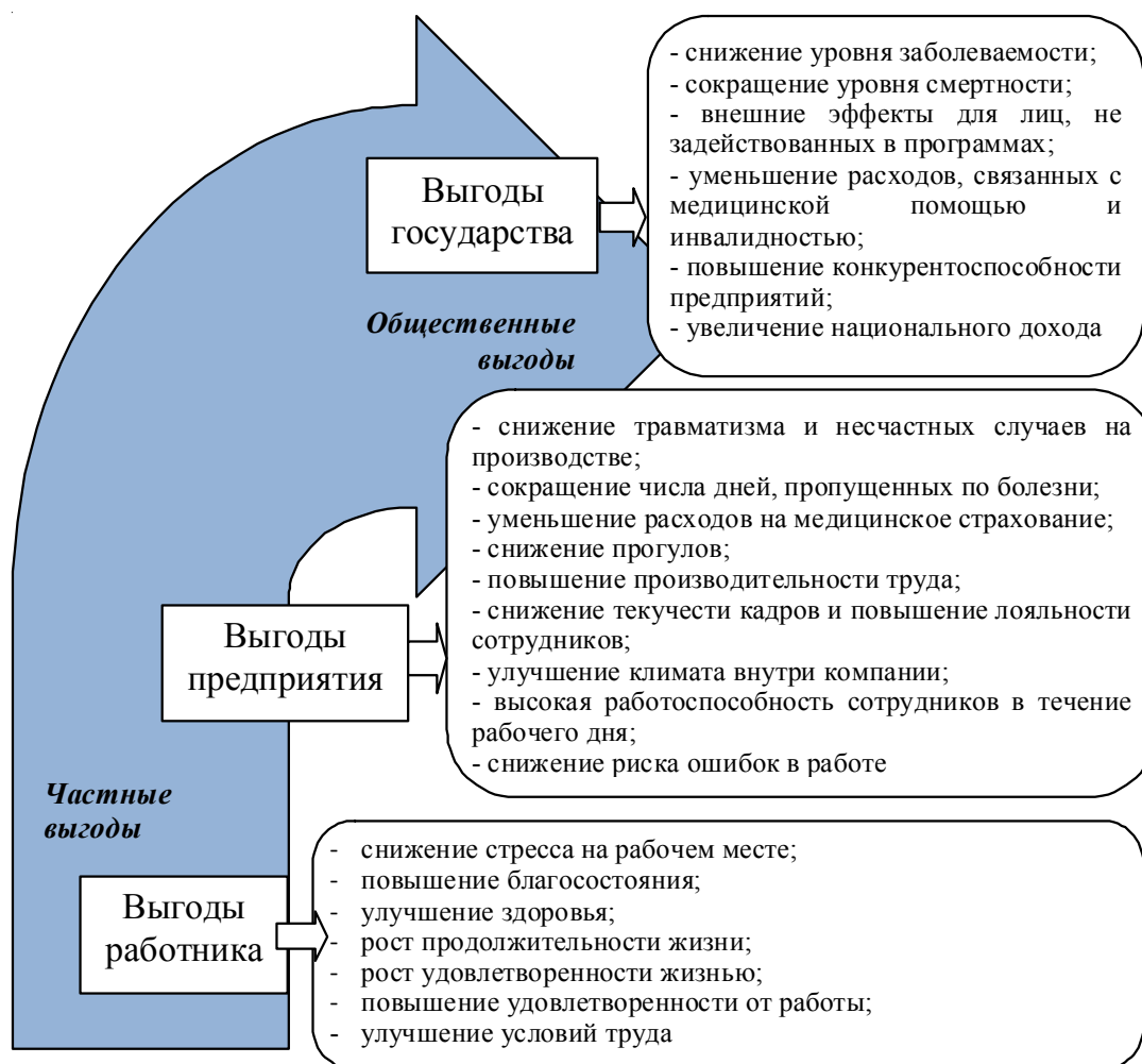
Рис. 2. Области факторного воздействия на здоровьесбережение современного предприятия Примечание. Составлено авторами.