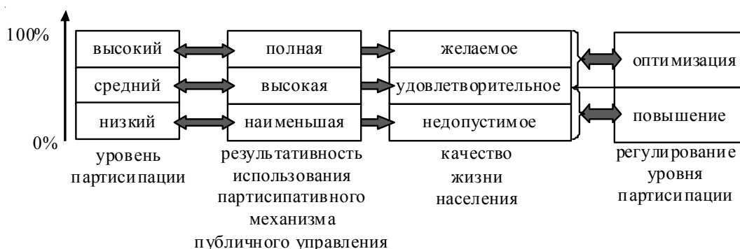
Рис. 2. Условия регулирования органами публичной власти уровня партисипации в зависимости от эффективности и результативности публичного управления *

Информация об эффективности и результативности публичного управления, а также о качестве жизни населения может быть получена органами публичной власти при осуществлении мониторинга удовлетворенности населения уровнем потребления материальных благ, индивидуальными условиями жизни, положением дел в государстве.