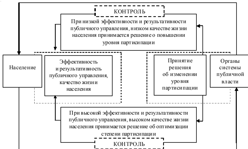
Рис. 3. Регулирование органами системы публичной власти уровня partisипации в зависимости от эффективности и результативности публичного управления, качества жизни населения *