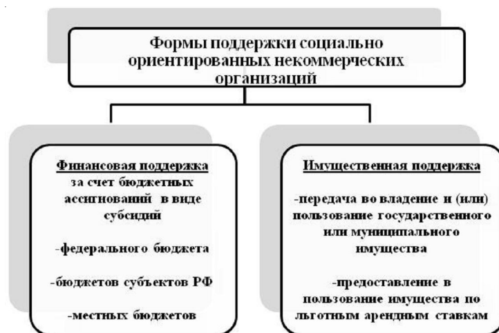
Рис. 2. Формы поддержки социально ориентированных некоммерческих организаций

4 – о примерном объеме доходов (до 300 тыс. руб., от 300 тыс. до 3 млн руб., свыше 3 млн руб.);