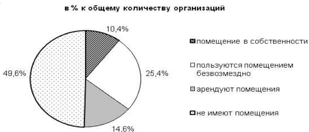
Рис. 5. Обеспеченность социально ориентированных некоммерческих организаций Волгоградской области помещениями в 2013 г.