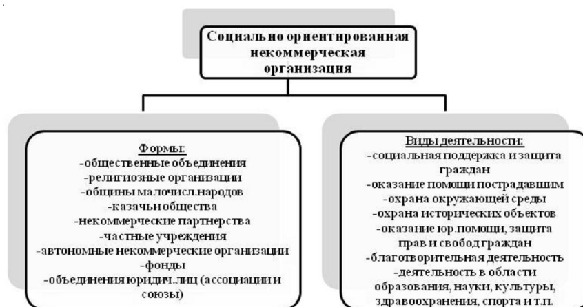
Рис. 1. Формы и виды деятельности социально ориентированных некоммерческих организаций

В соответствии с тем же законом (Федеральным законом от 5 апреля № 40-ФЗ [5]) органам государственной власти, местного самоуправления было предоставлено право оказывать поддержку социально ориентированным организациям: