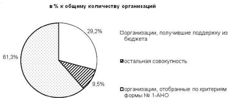
Рис. 3. Структура выборочной совокупности социально ориентированных некоммерческих организаций Волгоградской области за 2013 г.