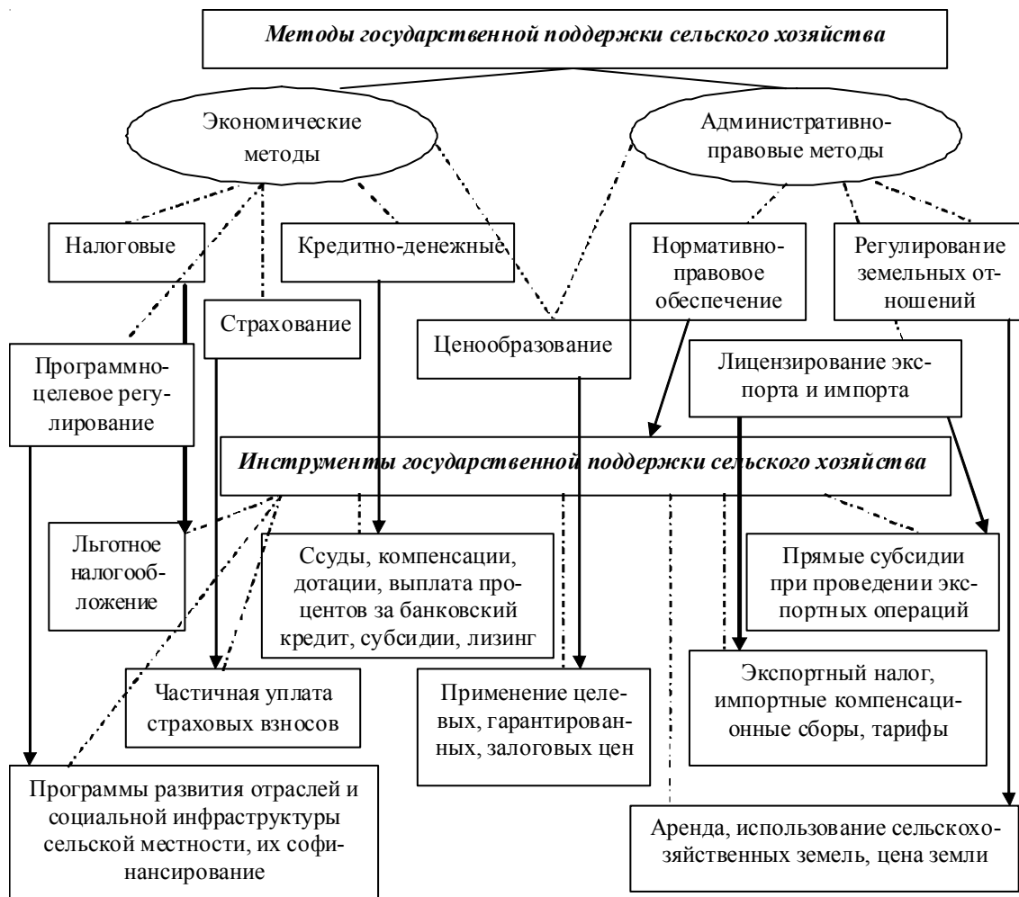
Рис. 1. Методы и инструменты государственной поддержки сельского хозяйства *

Центральное место в Государственной программе как по масштабам охвата участников, так и по финансированию отведено мероприятиям по достижению финансовой устойчивости сельского хозяйства [9, с. 75], включая пополнение уставных фондов ОАО «Россельхозбанк» и ОАО «Росагролизинг» (см. таблицу).