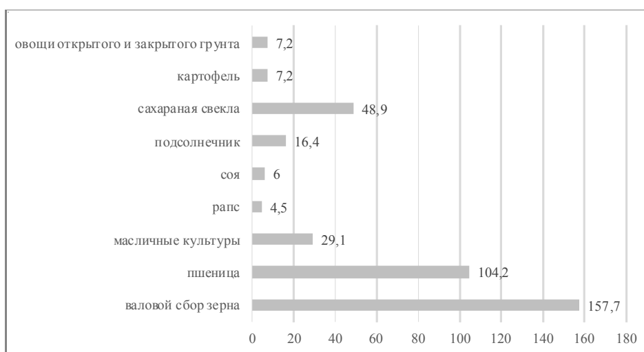
Рис. 2. Валовые сборы зерна в 2022 г., млн долл.

Примечание. Составлено автором по: [Как отреагировал на санкции ...].