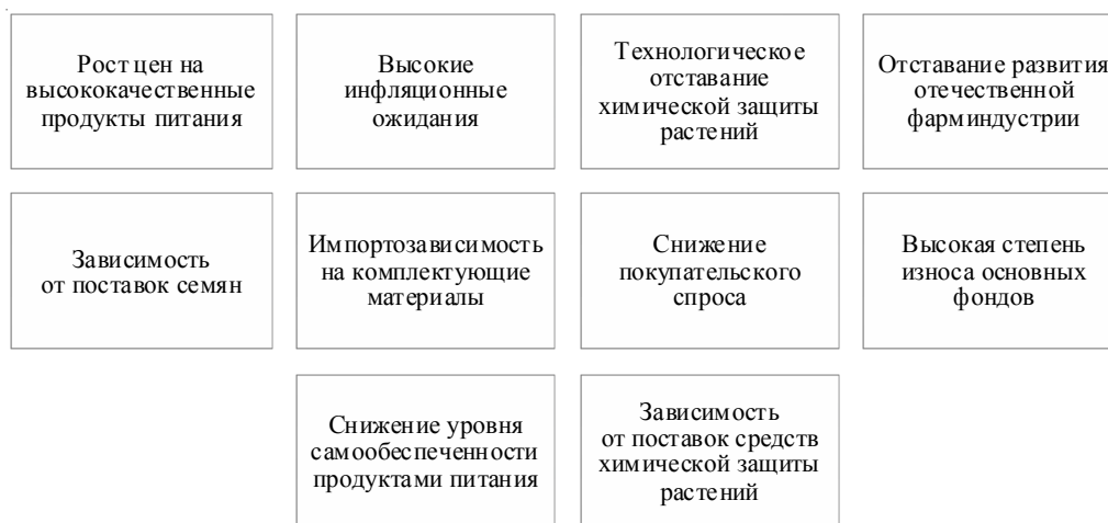
Рис. 4. Угрозы агропромышленного комплекса Российской Федерации

Примечание. Составлено автором по: [Итоги агропромышленного комплекса ...].