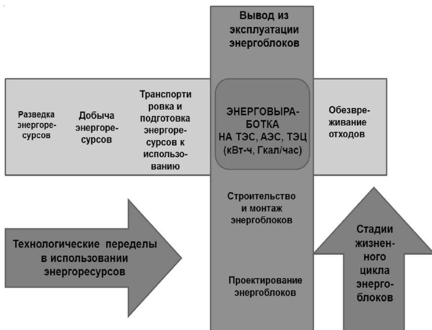
Рис. 6. Пример форсайт-модели «экономического креста» технологических процессов производителя электроэнергии в атомной энергетике

t – временной интервал, для которого рассчитываются экономические прогнозные показатели, включая компенсационные вып-