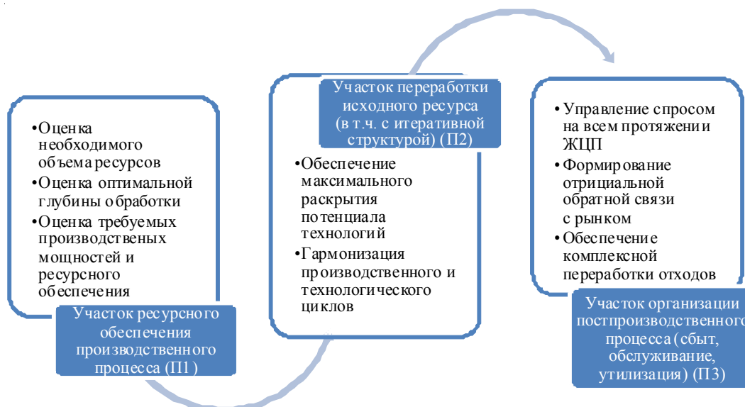
Рис. 4. Модель трехступенчатой производственной цепочки, представленной как последовательность замыкания технологических циклов