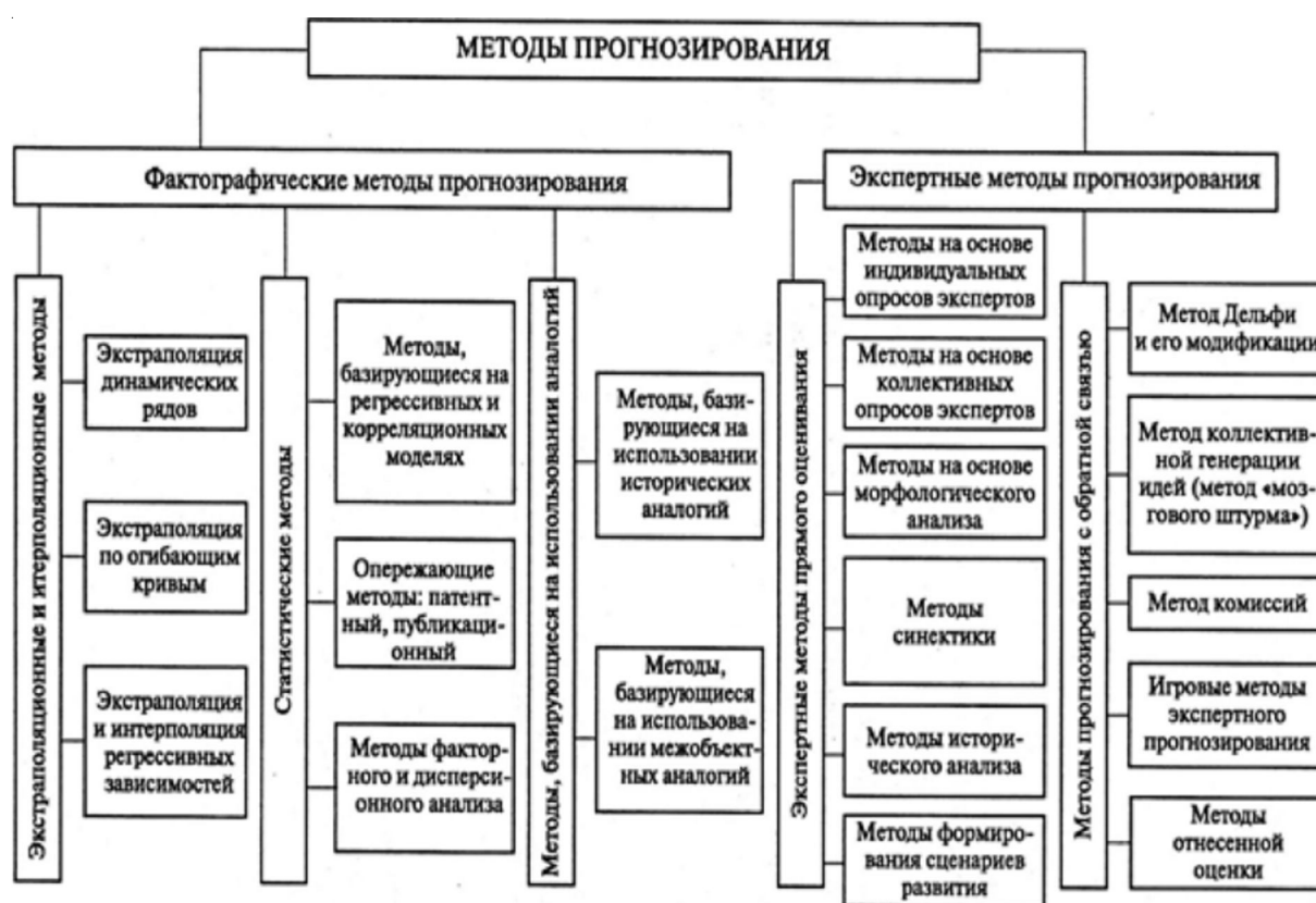
Рис. 1. Методы прогнозирования, сформированные и внедренные в экономическую практику в результате становления индустриальной экономики

Отличительной особенностью методов прогнозирования развития экономических систем, востребованных в период доминирования индустриальной экономики, является их ориентированность на моделирование образа