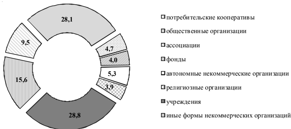
Рис. 2. Структура некоммерческого сектора региональной экономики на начало 2020 года, % к итогу (на начало года)

Примечание. Составлено по: [Общая характеристика ... , 2015; 2016; 2017; 2018; 2019; 2020].