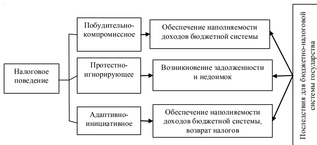
Рис. 2. Типы налогового поведения индивида и его финансовые последствия

Кроме того, налоговое поведение может являться как производным от имеющихся стратегий финансового поведения, так и прямым. Прямое налоговое поведение исходит из самой сущности налога и обязывает индивида уплачивать установленные законом налоги и сборы, тогда налоговое поведение проявляется как побудительно-компромиссное. При этом, если гражданин недобросовестен, он будет стремиться уклониться от уплаты налогов и сборов, скрывая свой доход, который может быть связан, например, либо с его предпринимательской деятельностью, либо со сдачей имущества в аренду. Уклоняясь от уплаты налогов, индивид сокращает поступление налогов и сборов в бюджетную систему, подвергается риску возникновения налоговой задолженности и, как следствие, административной и уголовной ответственности, что особенно важно для оценки его налогового поведения.