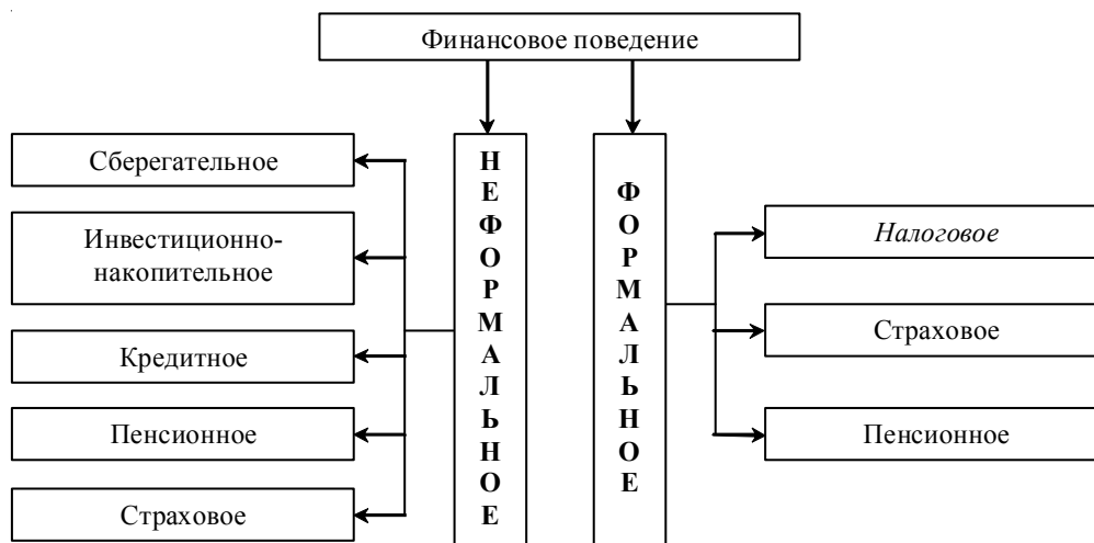
Рис. 1. Стратегии финансового поведения в рамках институционального подхода