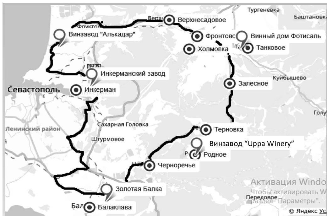
Рис. 3. Маршрут «Винная дорога Севастополя»