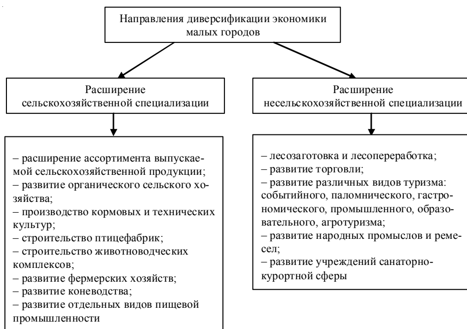
Рис. 3. Направления диверсификации экономики малых городов

Стратегия несвязанной диверсификации будет основана на развитии форм и видов деятельности, не имеющих непосредственной связи с сельским хозяйством, ее можно назвать стратегией расширения специализации экономики малых городов, а в некоторых случаях и ее полного изменения. К направлениям несвязанной диверсификации относятся: заготовка древесины и деревообработка, развитие народ-