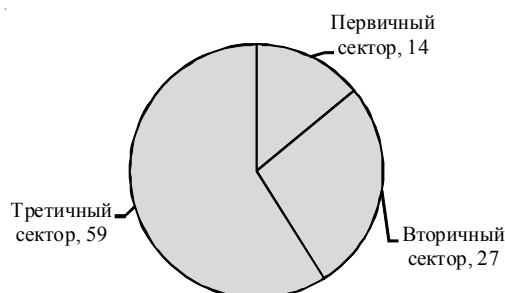
Рис. 2. Отраслевая структура занятости сельского населения в странах ОЭСР, %

В период с 2010 по 2015 г. численность жителей сел, занятых в сельском и лесном хозяйстве, охоте, рыболовстве и рыбоводстве, сократилась на 4 % (26 % против 22,1 %) [4]. Тем не менее сельское хозяйство все же остается преобладающим видом деятельности, его доля в общей структуре занятости составляет 22 %, следующей отраслью с наибольшей долей занятого населения является сфера торговли и бытовых услуг (14,5 %). Таким образом, трансформацию структуры занятости сельского населения можно считать общемировой тенденцией.