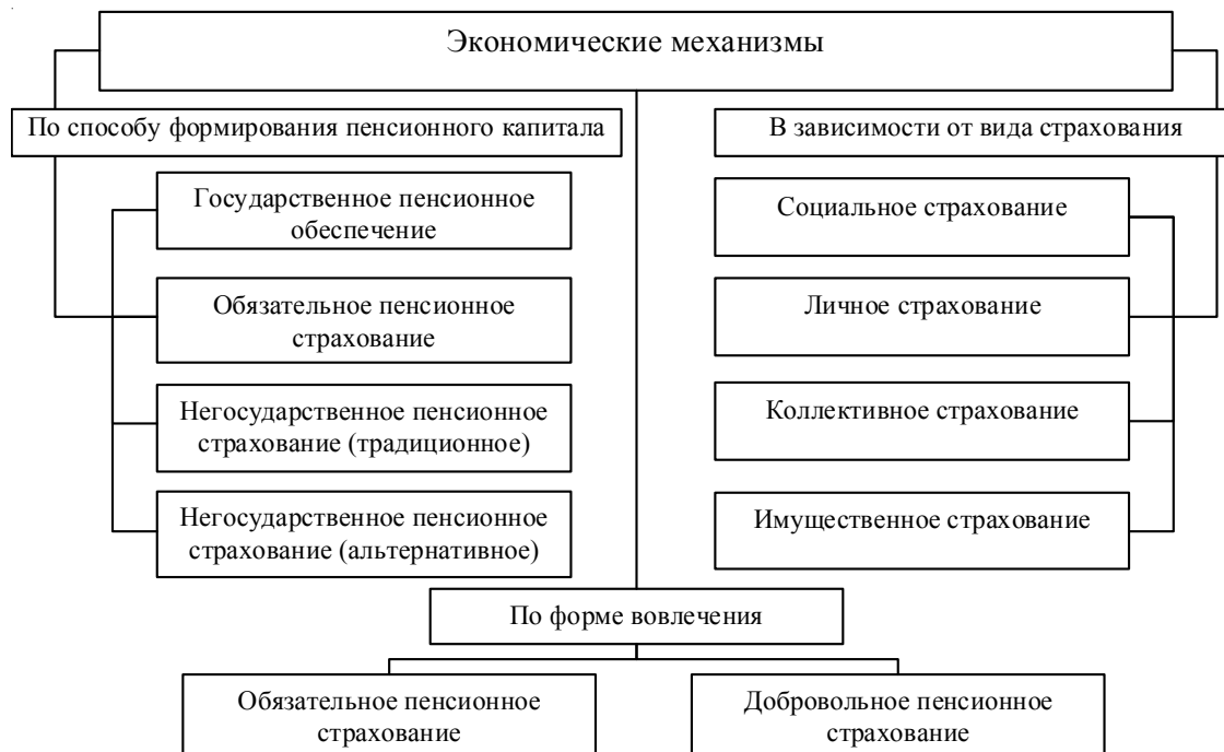
Рис. 1. Классификация экономических механизмов защиты от пенсионных рисков

Указанные системы реализуются на практике через экономические механизмы (рис. 1). Данные механизмы необходимо рассматривать с позиции их аддитивности, так как цель любого экономического механизма –