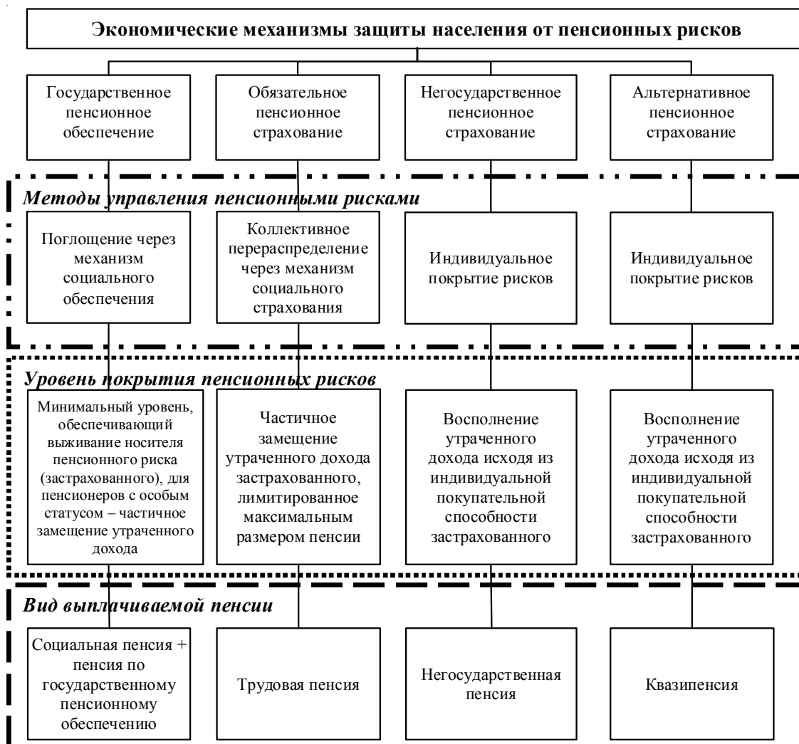
Рис. 3. Методы управления пенсионными рисками населения

Примечание. Составлено авторами по: [14].